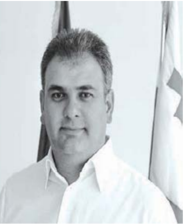
მუხეშვიტა მსოფლიო ასოციაცია ICOM