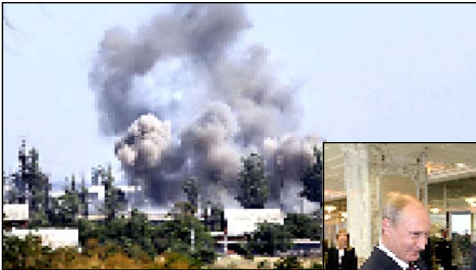
ძალისმიერი ზეწოლა და საინფორმაციო ომი