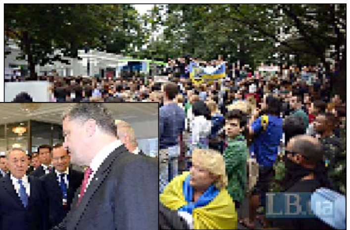
— გვ. 8 —