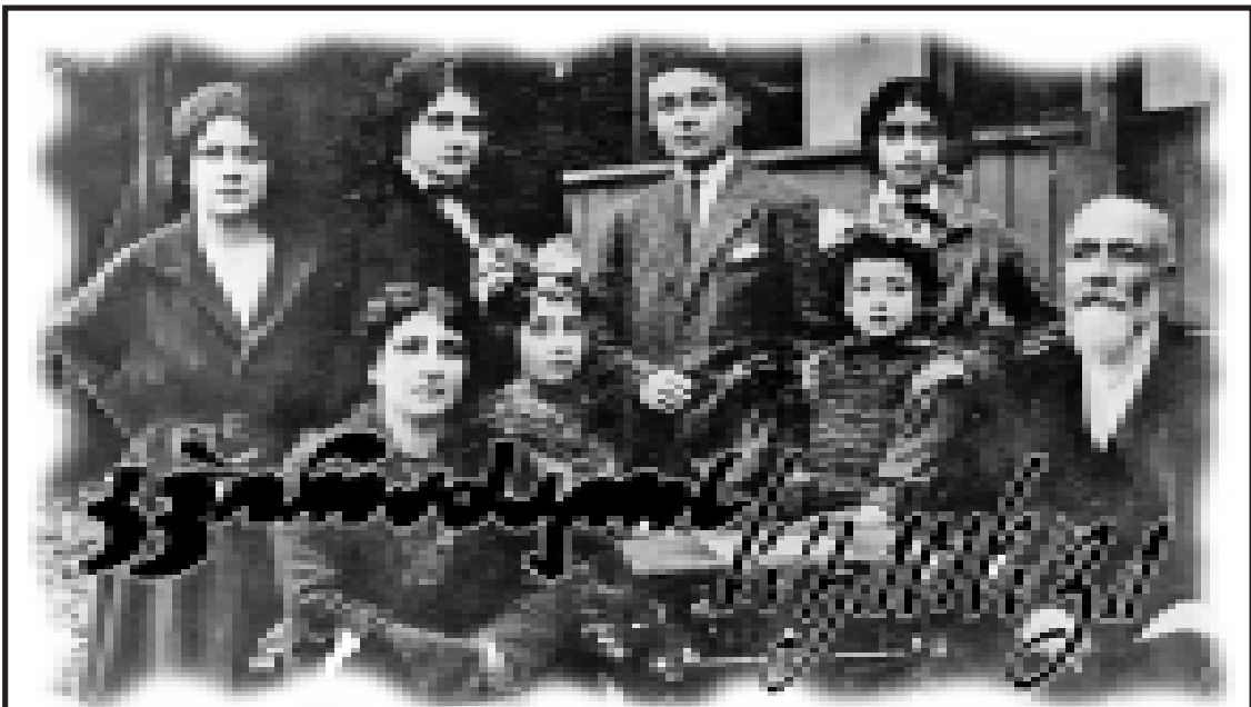
ყოველკვირეული ლიტერატურულ-კულტურული ჩანაწერი №97