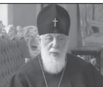
კათოლიკოს-პატრიარქი სასულიერო მსახურის დასრულების შემდეგ...