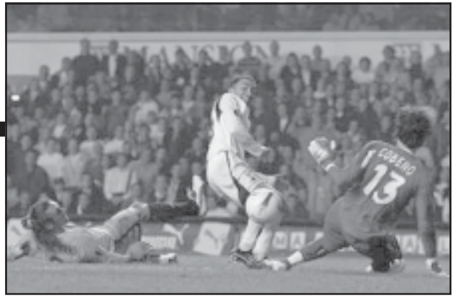
„ოსასუნა“ - „ლევიკოპუნი“ 1:0 (3:0მ, „პირადი“ - „ალკამარი“ 4:1 (0:0მ.