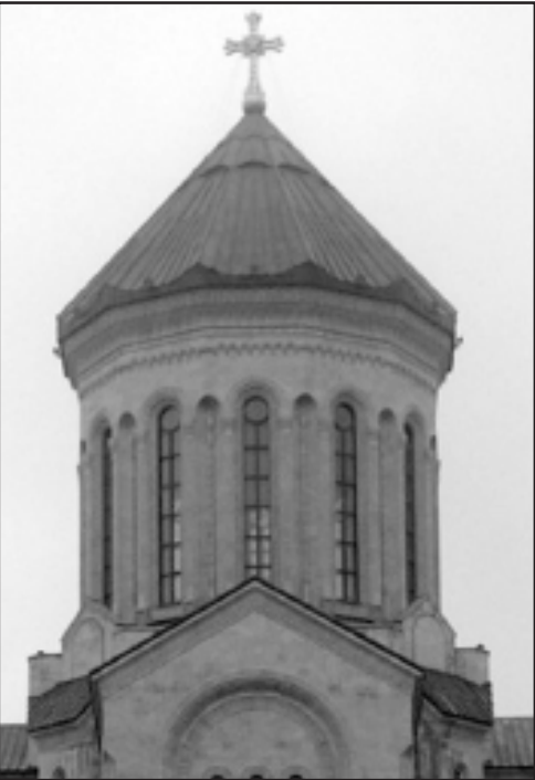
საბჭოთაების დროს, როდესაც რუსთაველი სამრევლო ტაძარს საბჭოთაო რელიგიური ცენტრების მსგავსად აღიქვამდნენ, მისი მშენებლობა და დასრულება შეწყვეტილი იქნა. იგი საბჭოთაო დროის დასრულების შემდეგ აღადგინდა.