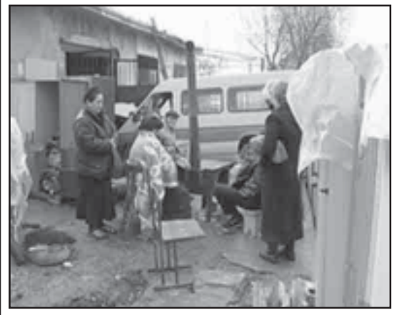
გლდანში, ძირის ქუჩაზე, პოლიციის აპარატისთან მდებარე შენობაში მცხოვრებმა აფხაზეთიდან დევნილებმა ღამე ღია ცის ქვეშ გაათენეს.

სუთსართულიან კორპუსში წვიმის გამო წყალი ჩავიდდა და ძირის ჩანაბრები. როგორც