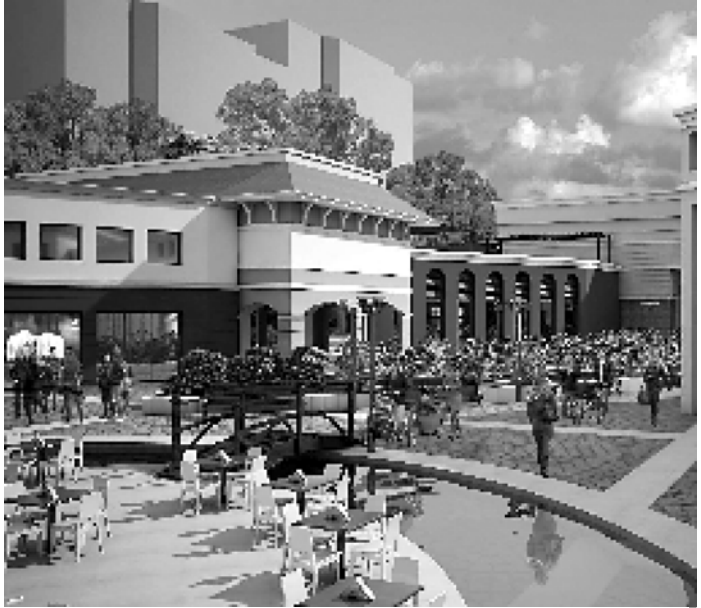
როგორც ხედავთ, მოლი არის ადგილი, რომელიც პროფილის დაწესებულებისაა, რაც თქვენს გარემოს, განსწობისა და გარდემობის გაუმჯობესებაზე აზრუნებს. მოკლედ რომ ვთქვათ, მოლი მოქმედ

მოლი სულ სამი დინსიან შედგება — ორი ხართული მანქანის ქვევით მოდიანად 900 ავტომანქანაზე გათვალავ პარკინგსა და 5000 კვ.მ. ფართობის საკომერციულ კომპლექსს. მანქანაზე და ხართული, კი ისეა დამონტაჟებული, რომ არ დაფაროს ხედები დრისის უბნების ფანჯრებისა. თითოეული დრისის მანქანადური სიმაღლე 3 მეტრია. დრისის მოლის კომერციული ფართობი კი საერთო ჯამში 17435 კვ.მ-ს შეადგენს.