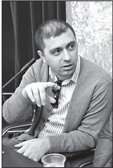
მის სერიოზული განხილვა.