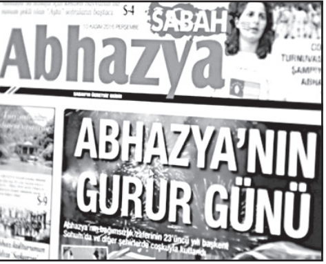
აფხაზეთისადმი მიძღვნილი გაზეთის პირველი ნომერი თურქეთის დასავლეთში, მარმარილოს ზღვის სანაპიროზე გავრცელდა.

გაზეთის ტირაჟმა 36 ათასი მიადნია. გიცა ირწმუნება, რომ ყველა ეგზემპლარი რამდენიმე საათში გაიყიდა. დიდი ინტერესის გათვალისწინებით, დამატებით დაიბეჭდა 5 ათასი ეგზემპლარი.