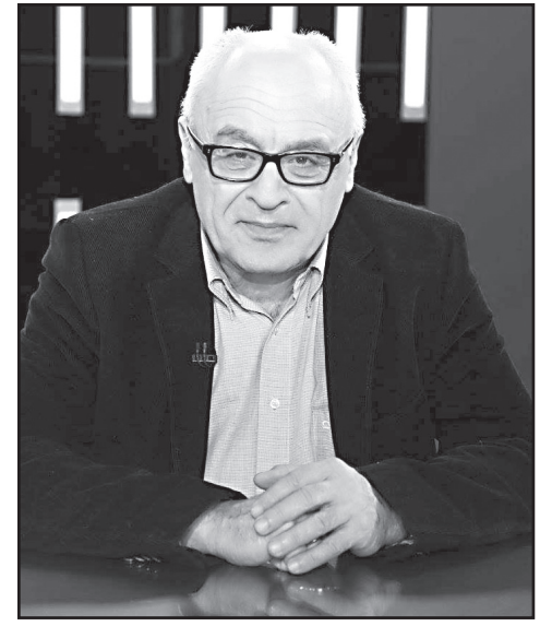
მა ინაშვილმა და ეს არ არის მოულოდნელი. დიას, ჩანს, ისინი სწორედ ამ მიმართულებით იმუშავენ. ამ პარტიას აქვს თავისი პოლიტიკური ბიოგრაფია. კიდევ ერთი, რაც მკაფიოდ იკვეთება, არის ის, რომ პარტიას მკვეთრი დაპირისპირება ექნება ნაციონალურ მოძრაობასთან. აქ, ალბათ, თანამშრომლობაზე საუბარი ზედმეტია.

არსებულ რეალობას და ამ რეალობაში წაგებული მიხეილ სააკაშვილი დარჩა? – ამ ეტაპისთვის სწორედ ასე ყალიბდება სურათი, როგორც თქვენ ბრძანებთ. დიას, ნაციონალური მოძრაობა შეეგუა არსებულ რეალობას. სხვა გზა მას არ ჰქონდა. – თუმცა, ასე არ ფიქრობს ყოფილი პრეზიდენტი. – დიას, სააკაშვილი ასე არ ფიქრობს, მაგრამ, ასევე ფაქტია, რომ მან აღიარა პარტიის დაყოფა და მას პარტიაში ღიად დაუპირისპირდნენ. – ამბობთ, რომ ბოკერიას სასარგებლოდ ერთი ნულია? – ჯერჯერობით ასეა, მაგრამ მე გიგა ბოკერიას არ გამოეყოფი და ვიტყვი გუნდს, რომელიც პარლამენტში შევიდა და რომელიც წინააღმდეგობა და სააკაშვილს ამ საკითხზე. მე ვფიქრობ, გუნდს აულო ალო ბოკერიამ, ამან მიიყვანა პროცესი ამ შედეგამდე და არა მგონია, მხოლოდ ბოკერია ყოფილიყო ამის ინიციატორი. – კიდევ ერთი ძალა, რომელმაც ბარიერი გადალახა, პატრიოტთა ალიანსია. ეს პარტია რა პოლიტიკას გაატარებს პარლამენტში? ირმა ინაშვილმა თქვა, რომ ისინი არასაპარლამენტო ოპოზიციის ფანჯარა იქნებიან პარლამენტში, მათ იდეებს გაახმოვანებენ. – დიას, ეს განცხადება გააკეთა ქალბატონ-