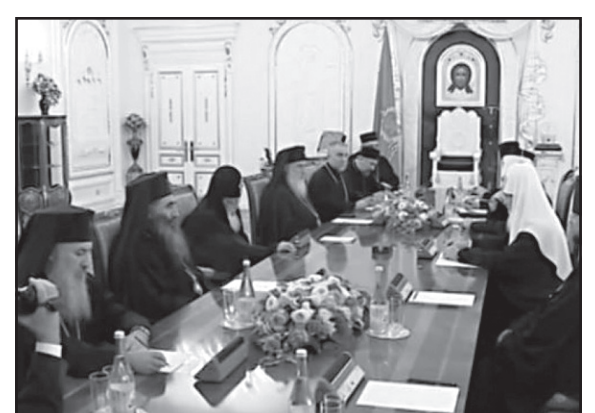
ვის მაცხოვრის ტაძარში საერთო წირვას დაესწრება, 23 ნოემბერს კი მოსკოვის ქართულ ეკლესიაში პარაკლისის გადაიხდის და დიასპორის წარმომადგენლებს შეხვდება. ნიუბოსტი

ილია მეორე რუსეთის პატრიარქ კირილს 70 წლის იუბილესადმი მიძღვნილ ღონისძიებებში მონაწილეობის მისაღებად ეწვია. საქართველოსა და რუსეთის პატრიარქების შეხვედრა მოსკოვში შედგა. პატრიარქების შეხვედრაზე საუბარი შეეხო ორი ეკლესიის ურთიერთობას. ეკლესიების მეთაურების თქმით, რუსული და ქართული ეკლესიებს შორის მეგობრობა პოლიტიკოსებისთვის, შესაძლოა, კარგ მაგალითად გამოდგეს: – თუ დიპლომატიები და პოლიტიკოსები მუშაობენ ცნობიერების დონეზე, ბიზნესმენები საფულისა და კუჭის, ეკლესია მუშაობს გულის დონეზე. ადამიანთა გულების კავშირის გარეშე შეუძლებელია, ქვეყნებსა და ხალხებს შორის კარგი ურთიერთობა იყოს, – განაცხადა პატრიარქმა კირილმა. – ჩვენი ეკლესიების ურთიერთობა პოლიტიკოსებისთვის მაგალითის წარმოადგენს, – აღნიშნა ილია მეორემ. ორი ქვეყნის პატრიარქებმა საქართველოში რუსი ტურისტებისა და მომლოცველების რიცხვის გაზრდაზე ისაუბრეს და ეს ფაქტი დადებითად შეაფასეს. დღეს, 21 ნოემბერს, ილია მეორე სხვა მართლმადიდებელი ეკლესიების წარმომადგენლებთან ერთად მოსკო-