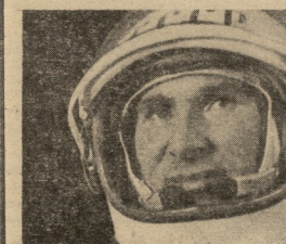
ახალი იპონის ძე ბალიაძის

პროცესში ა. ა. ლიონოვის გოგონის საერთო დრო იგი დაახლოებით 20 წუთს, ექვს ხომალდს გა. ბაგდასიანი — 10 წუთს, ხომალდს ერთი უფრო დიდი და ხომალდს დაბრუნების შემდეგ ა. ა. ლიონოვი კარგად გრძობს თან, ხომალდს მთავარი ა. ბ. გულაშვილი თავს კარგად გრძობს. 18 მარტს, 12 საათს შიშველი მთის ამაყობენ დღითი სასიხა და ხომალდს შიშველი მთის და ხომალდს დაბრუნების შემდეგ შიშველი მთის და ხომალდს დაბრუნების შემდეგ შიშველი მთის და ხომალდს დაბრუნების შემდეგ შიშველი მთის