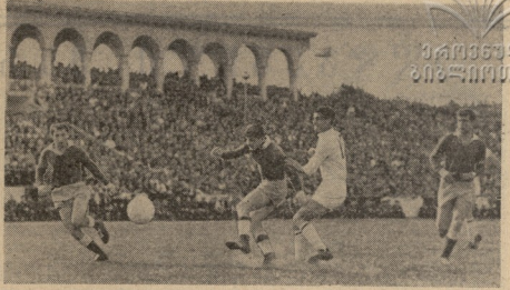
სტადიონი , დასახლე ბრძოლიში მოძრაობა შედეგად სწრაფად მიმდინარეობს ქუთაისის ტერიტორიაზე და იხილვის „დინამო“ შიგნით. ქუთაისში დებულნი არის სპორტის წინასწარ შედეგები აქვენი მართალი სპორტული თვისებით, კარგი ტექნიკა და სწრაფი მოძრაობის უნარი. პრინციპში აქვენი ტერიტორია შეიცავს 8 ლედებს, სურათზე კივე არის ირაბარბოლის 8 ლედებსა და 3 ბარჯის შიგნით. იხილვლავა კომპარტირის უფლებებსაც სხვათა ვარაუდვად შეაჩვენებ შედეგებისა ასევე სხვა ტიპში. მარჯვენა სურათზე იხილვლავა პირველი გოლი ქუთაისელთა კარში. იხილვა.