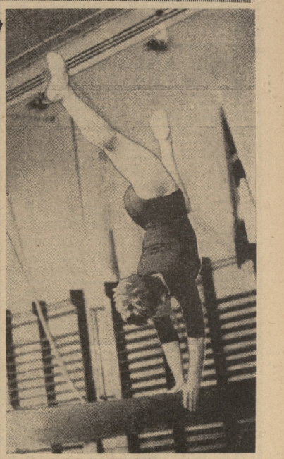
სსრ ჩეპირის პირეზონაჟა

ლუივიჲე სანტესობა სოციალისტური. ჩეპირის მსოფლიო ფეხბურთის მუხითე დაქმავთა და სოლე სიჭინავს იცეს ვაქეფების სანტესობა, რომ მატეუ დამოქმედება მა ვერღეღეღის იგი იღარჲე ამ ბრძობა სეკეუბრე ფეხბურთის (დასწული იბ მუ-3 ჟგ.)