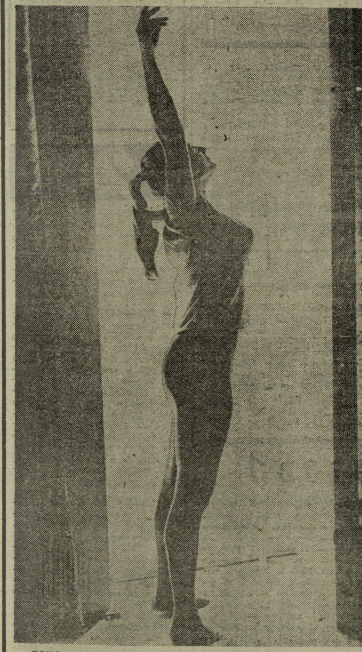
დილის ვარჯიში.

თში საშუალოდ 188,205 კმ სიჩქარე განავითარა. მისმა თანამემამულეებმა მ. მორისიტი და ტ. სიმციუმ შესაბამისად 188,019 და 182,588 კმ აჩვენეს. ევროპულ სამთომოთხილამურეთაგან საუკეთესო იყო ფინელი კ. შაკიანი — 182,555 კმ (IV ადგილი). ავსტრიელი ე. შვაგერის ძველი მიღწევა (179,193 კმ) სულ იპოვნის, ფინეთის, იტალიისა და ავსტრიის 11 სპორტსმენმა გააუმჯობესა. ამ შეჯიბრებისთვის იპოვნელთა სამთომოთხილამურეები სპეციალურ აეროდინამიკურ მიღებში ემსახურებოდნენ.