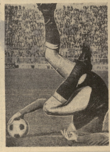
ბაქოში, თბილისში და სხვა ქვეყნებში...