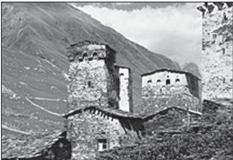
ციხისგან, რომელსაც აქამდე მთავრობის მიერ ადგილობრივი მთავრობის...