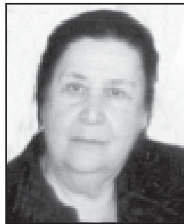
საპარტიო მდივანის მდივანის მდივანი აკადემიის; ბ. ელიაშვილის სახ. პატარა ბავშვების, მიკრობიოლოგიისა და ვირუსოლოგიის ინსტიტუტი.

აკადემიკოს თეიმურაზ ჭანიშვილის, საპარტიო მდივანის რედაქციის დირექტორის ორდენის კავალერის, მრავალი უცხოური პრემიის ლაურეატის, სამშობლოში უნებარედ შეყვარებული ადამიანის ხსენება საგულგნოდ დარჩება მისი მოსწავლეების, კოლეგებისა და მემორების მხსინძრებაში.