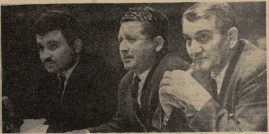
სარბეგ არ ცხებე ვენთა დღეა. მტევენი პირველი პირველი თეგ არ ზოგენ, ამ ნაგებთან დღეა ქუა, მხოლოდ ქუა, ასეა დღეა მ მოვარეგებს, რომლებს ხეობიდან სწავლს ვარსაგეებს ვარსე არ ამბებენ. მტეგე ე — ვულადანიდ იფევეტ თეგე პირველი, ჩათა შეუძნედილი არ დარჩე არც ერთი პირაობა, აფელი.