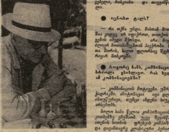
განსარდაო... 21.10, 21.10...