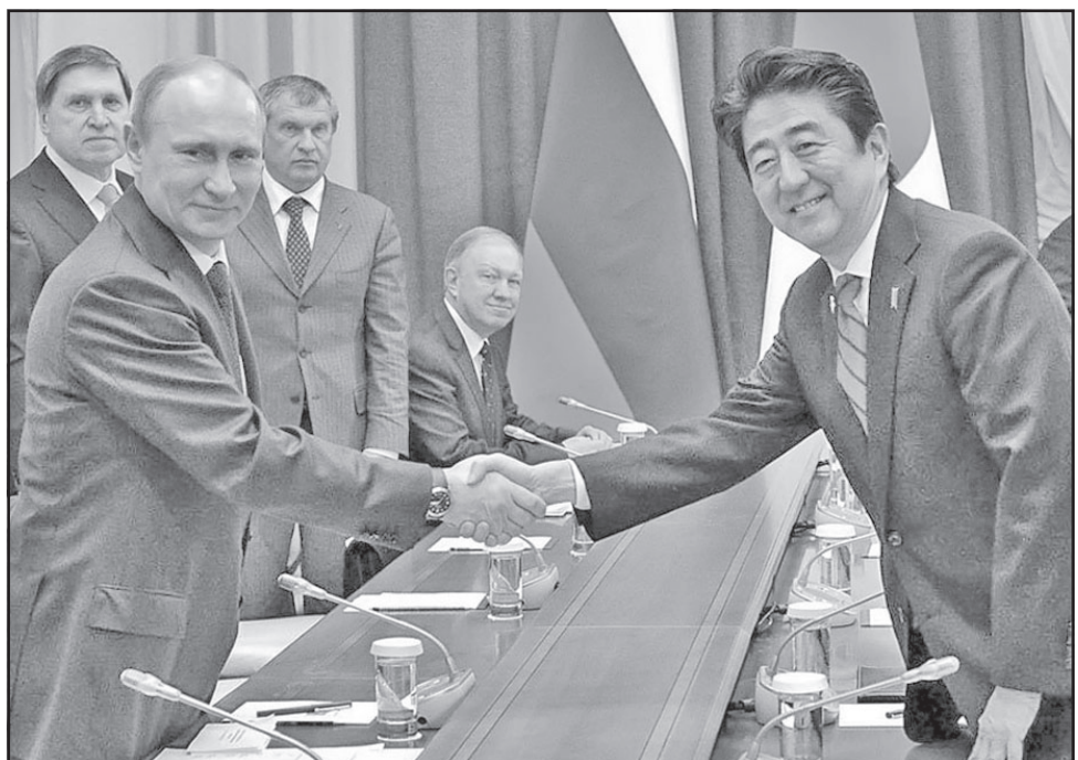
ქართველოს ეკონომიკური პარტნიორობა აფხაზეთსა და სამხრეთ ოსეთთან.

ყურადღება მიაქციეთ: მეორე მსოფლიო ომის დამთავრებისას კურილის არქიპელაგი სსრკ-ის შემადგენლობაში შევიდა (08.08.08 ხუთდღიანი ომის დამთავრების შემდეგ რუსეთის ფედერაციამ „აფხაზეთისა და სამხრეთ ოსეთის რესპუბლიკების დამოუკიდებლობა“ ცნო). ამის მიუხედავად, 1956 წელს იპაონი