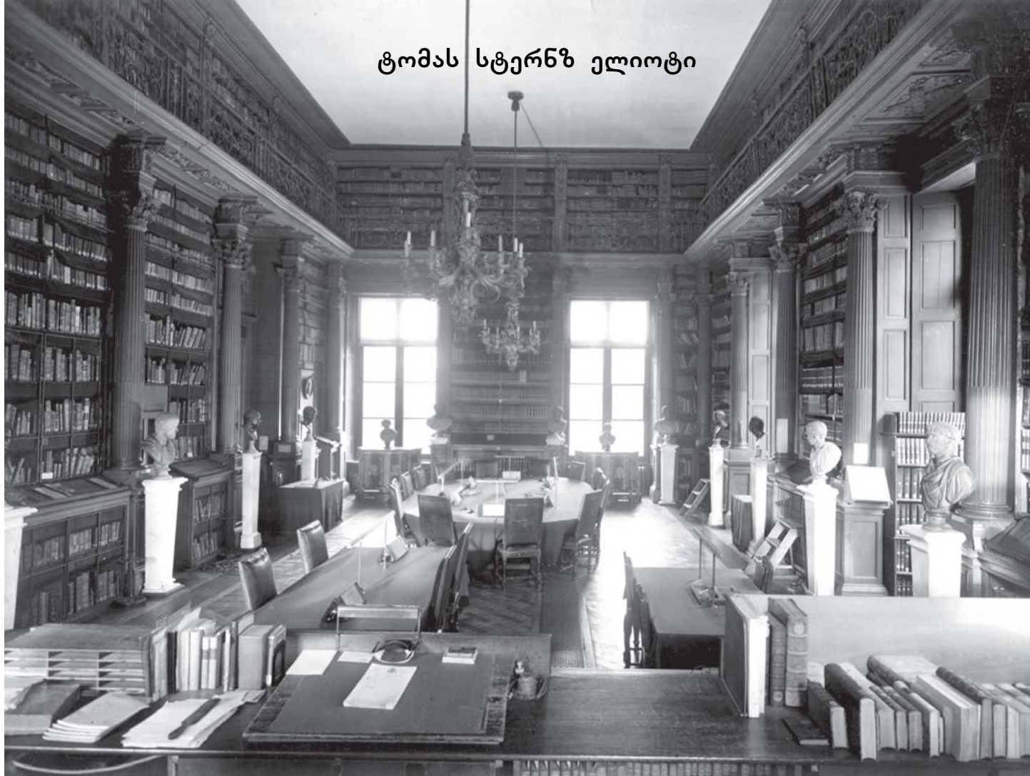
ტომას სტერნზ ელიოტი

ლილბას შეხვედრით რომეოკოსა და ჰობსთან, კლასიკური პროზის გამოფუჭებას კი, ორივე ენაში, ფორმულად და გიბონთან ნახავთ. ოღონდ ვრანგული დასაბამიდან უფრო მდიდარი და მონიფული იყო — უკვე ჟონივილსა და კომინთან — და ჩვენ არ გავაჩნია მონტენსა თუ რაბლესთან შესადარებელი პროზა. და თუ მრ. ვიბლი გავიანალიზებდა ამ სიცოცხლისუნარიანობას და გვეტყოდა თუ რატომ არიან ჰობსი და ანდერდაუნი, ნემი და მარტინ მარპრელატი ჯერაც წაკითხვის ღირსნი, მაშინ შეძლებდა ეჩვენებინა თუ როგორ გამოგვეცნო ეს თვისება, როცა ის, ან რაღაც მსგავსი, გამოჩნდებოდა ჩვენს დროში. მაგრამ მრ. ვიბლი ანალიტიკოსი არ გახლავთ. მისი გემოვნება მაშინაც კი ნაკლებ დამაჯერებელია, როცა მიმართულია მისი ეპოქის პიროვნებებისაკენ. სარეის თეთრი ლექსის საკითხში მოისუსტებს, იმდენი წყალობაც კი არ გამოიჩინა სარეისადმი, რომ ეჩვენებინა თუ როგორ განისაზღვრება მასთან ტენისონის საუკეთესო მიღწევანი. საქებარი სიტყვა არ გაუმეტებია გოლდინგისათვის, მართლაც რომ ერთი საუკეთესოსათვის ლექსის მთარგმნელთა შორის; მის ნაცვლად იბოდიშებს, ოვიდუსი ძალსა და ენერგიას არ მოითხოვს! მაგრამ ძალა და ენერგია თუნდ მხოლო-