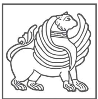
საქართველოს კულტურისა და ძეგლთა დაცვის სამინისტრო