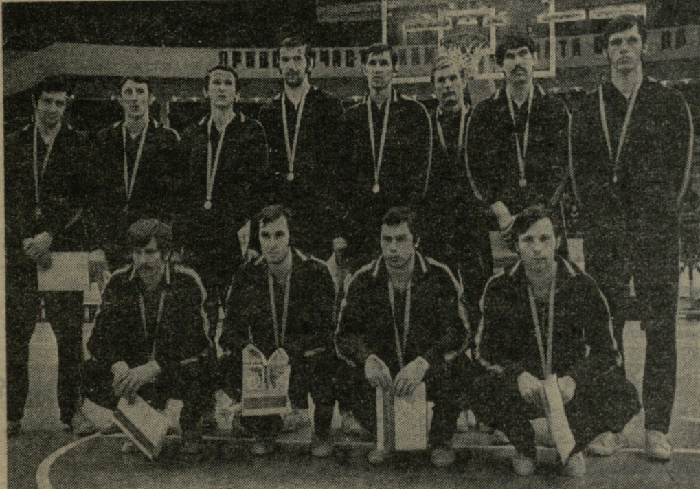
კალათბურთი — კალათბურთი