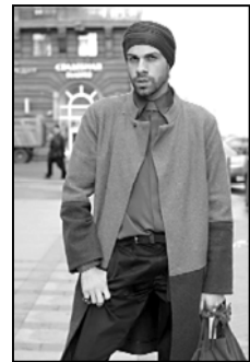
მაიკოეო ვერადგება ჩვენების პირველი ნაწილი, ხაზად გაიჭინავს ჩემი მას, კომპიუტერულ თემებს ნიშნის შედგენას!