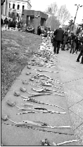
მეუღლეობის ვერაღ იყო მისული.

გუმინ ხესთაველის გამზიხზე 9 აპრილის მემორიალთან ხელისუფლების მალაჩინოსნები მივიდნენ. 9 აპრილს დღეულებს პატივს უცხობენ ხელისუფლების ნაჩივრებმა და მხარდებლებმა