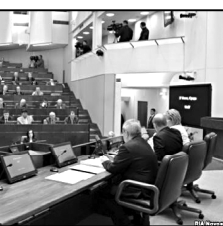
რუსეთის ფარგლებში რუსეთის საზოგადოებრივი ორგანიზაციის დაარსება

რუსეთის ფარგლებში რუსეთის საზოგადოებრივი ორგანიზაციის დაარსება. მისი ბინის ფართობი 800 კვადრატული მეტრით შეადგენდა.