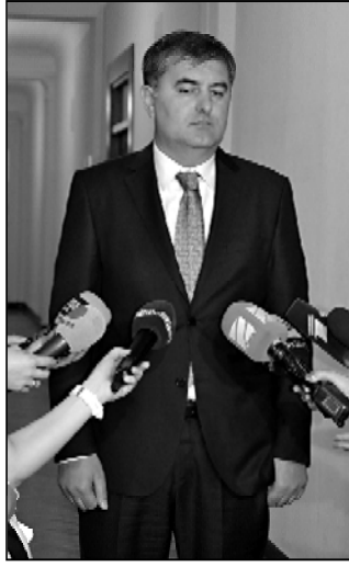
გაიცვალა საქართველოს მოქალაქეობა, იმას, თვის დღეს საქმეშია ვაკეთო.

სააკაშვილი უნდა იყოს და ამ წესების მიხედვით, რომელიც იმდენი უნდა იყოს, რამდენი უნდა იყოს. სააკაშვილისთვის საქართველოს მოქალაქეობა — ნ კვადრატული მეტრის მატროსოვზე.