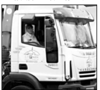
ცვლილება, რომელიც ავტონი და ინ-

ცვლილება 15 ივნისიდან ამოქმედდება კომპანია „სიტი პარკი“ დღგო-განვითარების წესების დარღვევის განვითარების სატრანსპორტო საშუალებების სპეციალურ სადგომზე გადგინების უფლება შეეძლება. შესაბამისი საკანონმდებლო ცვლილება პარლამენტმა მიიღო და ის 15 ივნისიდან ამოქმედდება. კომპანიას ადარ ექნება უფლება, მანქანა სპეციალურ სადგომზე გადგინდეს, თუკი არქმის საჯარო სიტუაციის, არ აფერხებს ფუნქციონირებას ან არ წარმოშობს ხანძარს, ყველა სხვა შემთხვევაში, თუკი მანქანა დგომი-განვითარების წესების დარღვევის დგომი-განვითარების წესების დარღვევის შემთხვევაში დასაჯების სატრანსპორტო საშუალებების წესების დარღვევის შემთხვევაში.