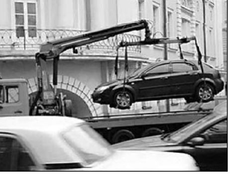
მანქანის ხელშეწყობის უფლება კომპანიას წარმოადგენს.

კომპანია „სიტი პარკი“ დღგო-განვითარების წესების დარღვევის განვითარების სატრანსპორტო საშუალებების სპეციალურ სადგომზე გადგინების უფლება შეეძლება. შესაბამისი საკანონმდებლო ცვლილება პარლამენტმა მიიღო და ის 15 ივნისიდან ამოქმედდება. კომპანიას ადარ ექნება უფლება, მანქანა სპეციალურ სადგომზე გადგინდეს, თუკი არქმის საჯარო სიტუაციის, არ აფერხებს ფუნქციონირებას ან არ წარმოშობს ხანძარს, ყველა სხვა შემთხვევაში, თუკი მანქანა დგომი-განვითარების წესების დარღვევის დგომი-განვითარების წესების დარღვევის შემთხვევაში დასაჯების სატრანსპორტო საშუალებების წესების დარღვევის შემთხვევაში.