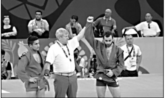
და მორალურ ძალას მითითებდა.