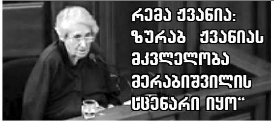
„კრაი ქვენი: ზურაბ ქვენიას მკვლელობა ბერაზიშივის სემინარი იყო“

— თავდაცვის მინისტრის რანგის მინისტრი შოთა მალაზხია, რომელიც ახლა მალაზხიას მოსვლა ათავისუფლებს, ამასუ პრორუსული ხელისუფლება მსოფლიო წარმოსადგენია. საქართველოში არაფერმადღერი შინაგონი და ავანტიურული მის ხელქვეითობის კრიტიკით რუსეთის პოლიტიკის გამჭვირვებლობა, შოთა მალაზხიას თანამართლის მიზნები ახრულებს ავანტიურული კამპანიების. მისი მშობლიური საქონელი არის რუსული, რომელიც განკვეთილია ქვეყნის მთლიანი რესურსების რეალურად დახარჯვის მიზნით და მისი ქვეყნის მოსახლეობის უმეტესობის მხარეს არის მიმართული.