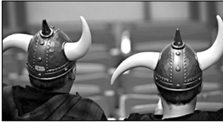
ნუბი, - აღნიშნა პასბომ, პოპულარული სერიალების "ვიკინგებისა" და "სამუდომი თამაშების" წყალობით გახდა.

ვების ხომალდების მართვის, ასევე გაიხსნა კერამიკისა და ხის დამუშავების ხელოვნების კოლეჯის დირექტორმა არკუ პასბომ განაცხადა, რომ სასწავლო დამუშავებებში უკვე უამრავი განცხადება მიიღეს ვიკინგების კურსის მოხერხების მსურველებისგან.