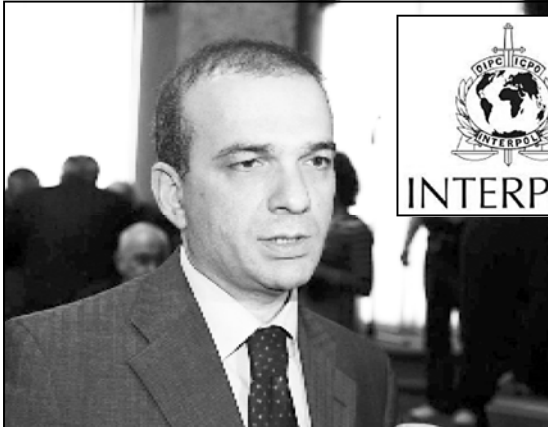
„თავდაცვის მინისტრი შოთა მალაზხია“

რას ნიშნავს განცხადებები საქართველოს ხელისუფლებაში პრორუსული ძალების მოხალდებით მისვლის შესახებ? რატომ უნდა იმართდეს დღევანდელი ხელისუფლება? რატომ არ არის მობილიზებული საქართველოსთვის მათის მიხედვით? რას ვმასხურება ანტიამერიკული ფორმების ციკლი? შესაძლებელია თუ არა კავკასიელების ერთობა? — ასაკლი თაბია ამ და სხვა საკითხებზე ესაუბრა პარლამენტის უმცირესობის წევრი, ქრისტიანულ-კონსერვატიული პარტიის ლიდერი შოთა მალაზხია