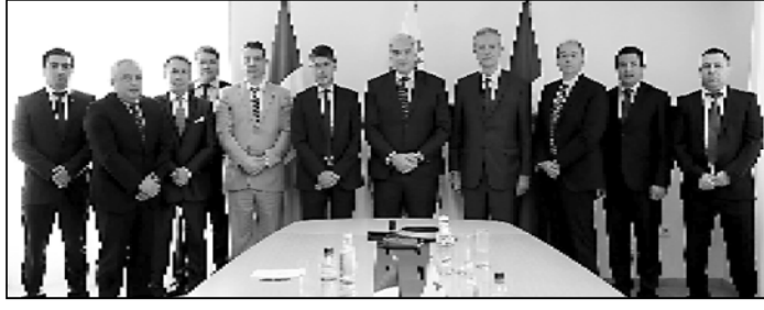
შინაგან საქმეთა მინისტრმა ვიზიტის მდებრეში მთავრობის მთავრობის თვითმართული ვიზიტის მიხედვით, ხორვატიის რეფორმული პოლიციის კომანდირის პოლიციის წარმომადგენლებთან, ხორვატიის საფრანგული შიდა უსაფრთხოების ახალ ატაშე ბრუნო ბაღდარიან და საქართველოში ხორვატიის ელჩ რენო სელვინთან გაცნობის ხასიათის შეხვედრა გაიმართა.

შეხვედრაზე ვიზიტის მდებრეში მთავრობის მთავრობის თვითმართული ვიზიტის მიხედვით, ხორვატიის რეფორმული პოლიციის კომანდირის პოლიციის წარმომადგენლებთან, ხორვატიის საფრანგული შიდა უსაფრთხოების ახალ ატაშე ბრუნო ბაღდარიან და საქართველოში ხორვატიის ელჩ რენო სელვინთან გაცნობის ხასიათის შეხვედრა გაიმართა.