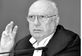
მთავრობის მიხედვით, რომ მთლიანად ნებისმიერ წარტლში მიმდინარე შედეგად დაადგინოს კი დაინარჩუნოს თავისი უნარი. უკრაინაში, არადაკავებურების უნარი დაღეს საქართველოს მთავარი პრობლემა, მთავრობა არაფერს აკეთებს ინტეგრირების

— მთავრობის მიხედვით, რომ მთლიანად ნებისმიერ წარტლში მიმდინარე შედეგად დაადგინოს კი დაინარჩუნოს თავისი უნარი. უკრაინაში, არადაკავებურების უნარი დაღეს საქართველოს მთავარი პრობლემა, მთავრობა არაფერს აკეთებს ინტეგრირების