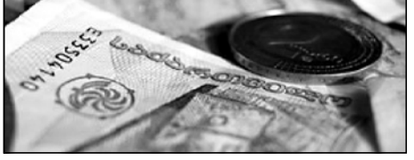
სხუ-ის ანალიზისა და პროგნოზის მიხედვით, ეკონომიკის განვითარების მინისტრი დიმიტრი ქუციაშვილის თქმით, საშუალოდანი პერიოდში ლარი ატყდება გაუმჯობესებას.