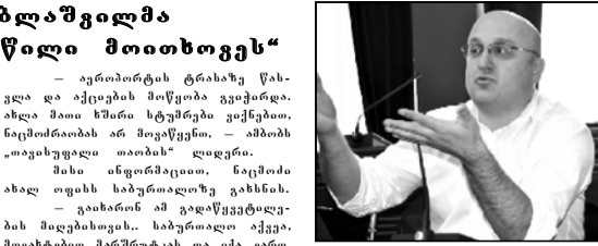
ნაციონალური სათავეო ოფისის მენეჯერი

ნაციონალური სათავეო ოფისის მენეჯერი და გოგა ხანიძემ წილი მითხოვეს.