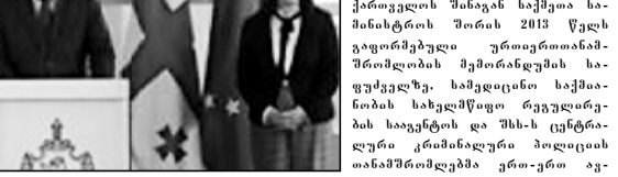
უსს-მ და ჯანდაცვის სამინისტროს სამსახურში მუშაობის შესახებ