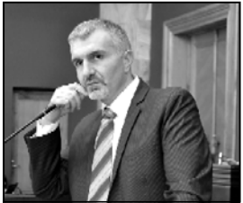
ნაციონალური სათავეო ოფისის მენეჯერი

— ნაციონალური სათავეო ოფისი 3,5 მილიონ დოლარად ყიდის. — განიხილა მოაზრობის აღმასტრუქტორი კელი.