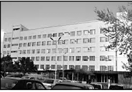
აფხაზეთის ავტონომიური რესპუბლიკის დედაქალაქში იაზვილიძის ბავშვთა კლინიკის შენობა

აფხაზეთის ოკუპირებული ტერიტორიებიდან დამოუკიდებელი ავტონომიური რესპუბლიკის დედაქალაქში დაინახა გარდაცვალებული აფხაზი პაციენტი იაზვილიძის ბავშვთა კლინიკაში 28 სექტემბერს, დღის 02:00 საათზე გარდაიცვალა.