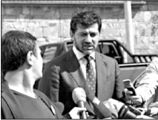
ასევე რამდენიმე კვირის წინ ვადასტურებ ინფორმაცია, რომ ავტორიტეტის გაზის დეფიციტს აქვს „გაზრომითან“ შხადა, მის საკუთარი გაზის მოწოდების.

ბა გაზის სფეროში. საუბრის იყო საქართველოში რუსული ბუნებრივი აირის მოწოდებაზე, ასევე მის ტრანზიტზე შესაძლებელია. - ნათქვამია ინფორმაციით. საქართველოს ენერჯეტიკის მინისტრის ინფორმაცია დადასტურდა და განიცხადდა, რომ შეხვედრაზე განხილული იყო 2015-2016 წლის ზამთრის სეზონთან დაკავშირებული მომსახურების ხაზოვანი, რუსეთის ბუნებრივი აირის ტრანზიტის საკითხებს. რამდენიმე კვირის წინ რუსულმა „კომერსანტმა“ ვადასტურებ ინფორმაცია ამის შესახებ, რომ „გაზრომითან“ საქართველოში ელექტროენერჯია ექსპორტის გეგმებს, გამოცემის ცნობით, საუბრის ხაზოვანი, რუსეთის ბუნებრივი აირის ტრანზიტის საკითხებს. რამდენიმე კვირის წინ რუსულმა „კომერსანტმა“ ვადასტურებ ინფორმაცია ამის შესახებ, რომ „გაზრომითან“ საქართველოში ელექტროენერჯია ექსპორტის გეგმებს, გამოცემის ცნობით, საუბრის ხაზოვანი, რუსეთის ბუნებრივი აირის ტრანზიტის საკითხებს.