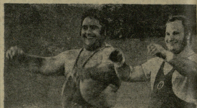
სსრ კავშირის ევროპის, მსოფლიოსა და მონრეალის ოლიმპიურ თამაშების ჩემპიონის ვ. ალექსეიევის ანგარიშზე 80 მსოფლიო რეკორდი. რიანელმა გოლიათმა ბოლო წარმატებას დიდი ოქტომბრის მე-80 წლისთავისათვის მიძღვნილ სპორტულ დღესასწაულზე მიადწია, სადაც მან 256 კგ აკრა... სურათზე ვ. ალექსეიევი (მარცხნივ) და მსოფლიოს ერთ-ერთი უძლიერესი მიმწეწონიანი გ. ბონკი (ჯვრ).