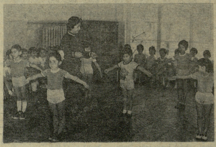
ჯანმრთელი მომავალი თაობის აღზრდა სახევეო ბაღიდან იწყება და სწორედ ამიტომ თბილისის ლენინის რაიონის მეცხრე სახევეო ბაღში (დირექტორი თ. ზახალაძე) დიდ ყურადღებას უთმობენ პატარების ფიზიკურ მომზადებას.

დამთავრდა „ლოკომოტივის“ ცენტრალური საბჭოს პირად-გუნდური ჩემპიონატი კრივიში. ასპარეზობაში 14 კოლექტივი მონაწილეობდა. ამიერკავკასიის საგზაო საბჭოს ნაკრებმა გუნდმა ყველა მეტრეჯი აჯობა და საერთო პირველობა მოიგო. ამ გუნდის წევრებმა პირად ტურნირში ხუთი საპრიზო ადგილი დაიკავეს