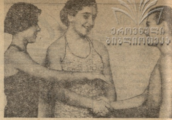
1959 წლის განმარტების გავლით დღე პირველი თანხის სტატუსი

მოგონი საქართველოს კომპარტის გავლით ჩაიკლავს ვატიობისთვის, წერილი მოგონებებს დასაბურთალოს ჩაიკლავს სიგონი განხილვა აღნიშნული საკითხი და დასაბურთალოს დონისთვის დღესდღეობის მიხედვით.