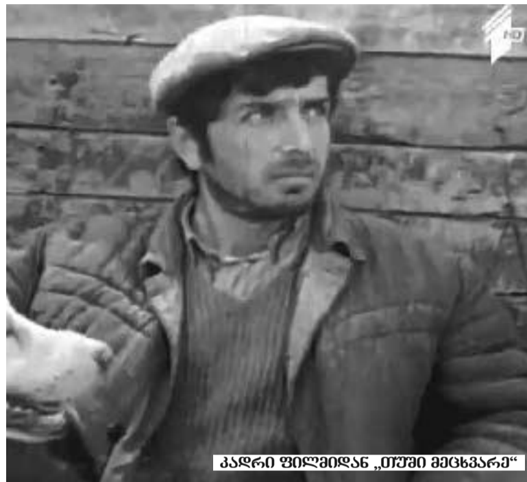
კადრი ფილმიდან „თუშუნი მეცხვარი“

ადვილი იყო, რადგან, კომუნისტური იმპერია დიდ ზეწოლას ახდენდა ხელოვანზე (განსაკუთრებით ნიჭიერსა და სინდისიერზე): ასაჩუქრებდა, აშინებდა, იჭერდა, ადრე კი ანადგურებდა კიდევ. ხელოვანს ზოტბა უნდა შეესხა მისი ბელადებისათვის, უნდა შეელამაზებინა (ანუ - დაემახინჯებინა) ისტორია, დღევანდელი დღე, განუწყვეტლივ უნდა ემტკიცებინა, რომ არავითარი ღმერთი არ არსებობდა, რომ მომავალი ეკუთვნოდა მხოლოდ და მხოლოდ კომუნიზმს, რომ ამ იდეოლოგიის გარეშე კაცობრიობას დაღუპვა ელოდა და, რაც მთავარია, იმჟამად ძალაუფლება სწორედ იმით ქონდა, ვისაც უნდა ქონდა და ჩვენივეს, საბჭოთა ხალხისათვის, მათ მონობაზე დიდი სიხარული რა შეიძლება ყოფილიყო! ჩვენ გვაძგადა ყველაფერი ეს, გვაძგადა ჩვენი დამხეობელი კომუნისტური იმპერია მის ბინძური წარსულითა და სრულიად უპერსპექტივო მომავლით. ჩვენ ვიცოდით, რომ ილიაც მართალი იყო, ვაჟაც და დოსტოვესკიც, რომლებიც იმთავითვე მიხვდნენ, რომ ბოლშევიკებს სოციალიზმ-კომუნიზმის მითოლოგია მხოლოდ ძალაუფლების ხელში ჩასაგდებად ჭირდებოდათ და რომ არავითარი ნათელი მომავალი მათ სინამდვილეში არა აქვთ. ჩვენ ვიცოდით, რომ მიუხედავად იმისა, რომ რუსეთის ამ მოღვინიზირებულ იმპერიას იცავს ატომური იარაღი, უთვალავი არმია, უშიშროების სამსახურები, სოციალისტური დემოკრატია და უძლიერესი ფინანსები, - ისტორიულად იგი მაინც