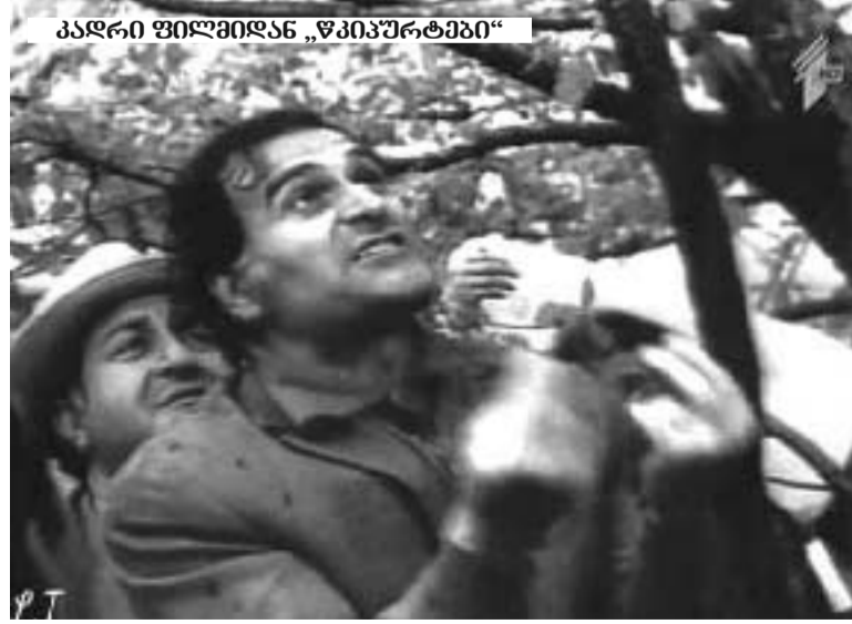
კადრი ფილმიდან „წიკიპურტები“

უმათავრესი მაინც იყო პრინციპი: არ წაგებოთ სულმა და არ მიევიდოთ კომუნისტებს, დაიცავთ ხელოვანის დამოუკიდებლობა ყველაფრისგან, გარდა სინდისისა... ეს კი არც ისე