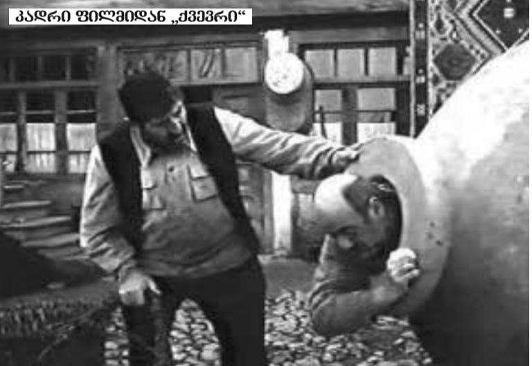
კადრი ფილმიდან „ქვევრი“

ეს ფილმი უკვე გახალხურდა და ცნობიერებაში შევიდა, როგორც ჩვენი ყოფიერების ნაწილი. იგი ყველაზე დახურული გულია და გონების კარებს აღებს. მაყურებელი (და არა მარტო ქართველი) სრულ თანხვედრას გრძნობს მოქმედ პირებთან, მოლიანად შედის ფილმის სტიქიაში, თითქოს ესიზმრებოდნენ ყველაფერს და ერთ მომენტში იქნებ ასხენდებოდა კიდეც, რომ ოდესღაც, რომელიღაც საიდუმლო დროს, აქ ცხოვრობდა, მთებში, ამ ხალხის გვერდით და თვითონ იყო აი ეს თუშუნი! იგი აღიქვამს ყველაფერს, როგორც ერთხელ უკვე განცდილს და თითქოს ახლა, გაკვირვებული, კვლავ უბრუნდება თავის განვლილ ცხოვრებას უდიდესი ინტერესითა და თანაგრძნობით. ნუ ვიკითხავთ როგორ მოახერხა ეს სოსომ. ამის საიდუმლო ამოუხსენელია და გამოითქმება მხოლოდ გალაქტიონის სიტყვებით: ნიჭი, ბიძიკო, ნიჭი!