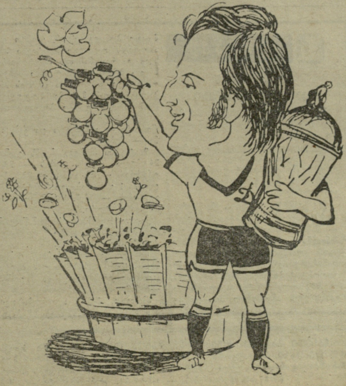
„ოქროს“ შემოღობვა. გ. იაშვილის ნახატი.