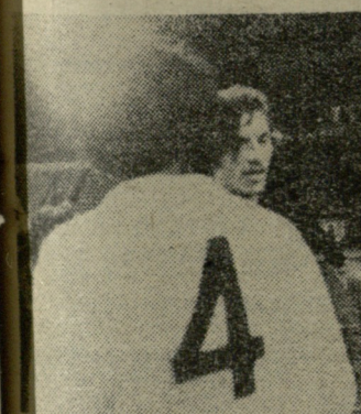
მოსკოვის „ლოკომოტივის“ ფეხბურთელმა პირველმა მიულოცეს თბილისის დინამოელებს ჩემპიონობა.

ქუთაისის „ტორპედოს“ ფეხბურთელთა კოლექტივი.