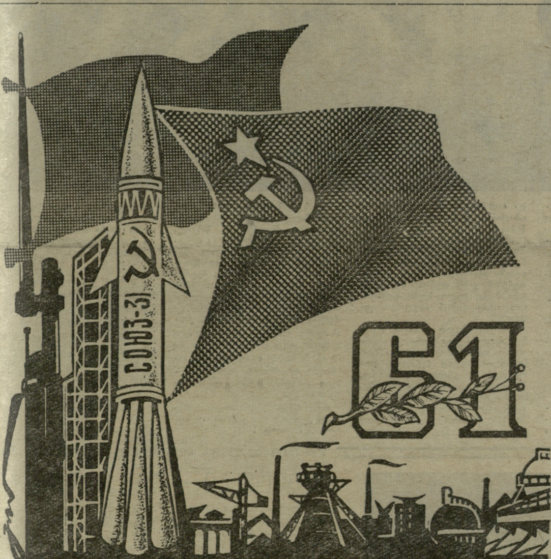
გ. იაშვილის ნახატი.

აღსრულდა სპორტის მოყვარულთა ოცნება — თბილისის „ლინამოს“ ფიზკულტურულ-გამაჯობებელი მოიხვედრის სსრ კავშირის ჩამოყალიბების ოქროს მედალით. თამი გამოიჩინა „ლოკომოტივის“ რეაბილიტაციის, რომელიც საკავშირო თანის მფლობელია გახდა. ჩამი ბიზნისის ეს გამაჯობებელი ფიზკულტურული საკავშირო საკავშირო.