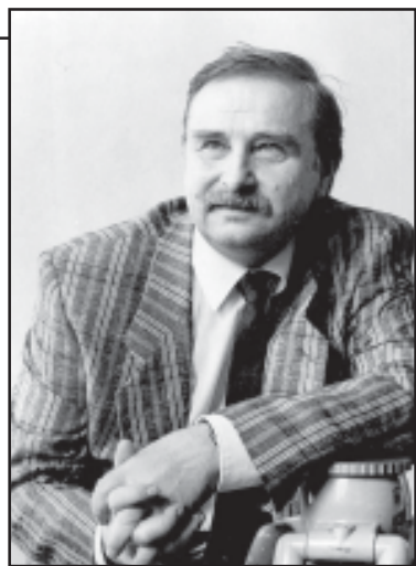
იყო, მაგრამ ზაქარიას მაინც ვერ გა-მოჰქონდა აზრი.

ახლა თითოეული სიტყვა რაღა-ცას ნიშნავდა, სუყველა იტალიური