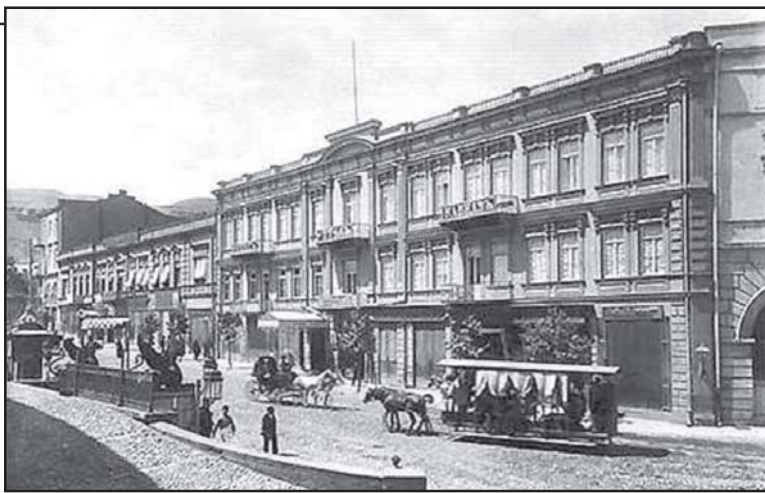
მცხეთის... ილუზია და რეალობა... თვალსაწიერი... ილუზია და რეალობა...