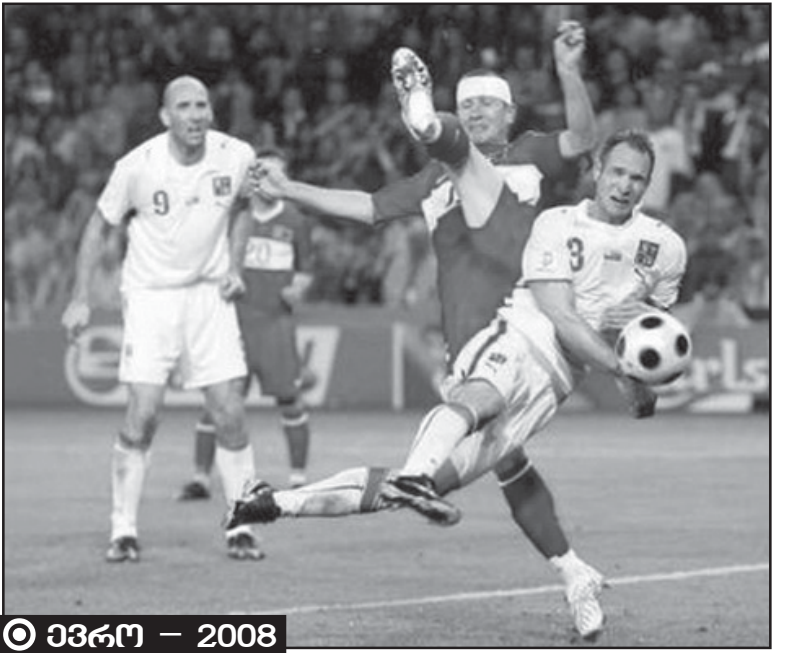
ევრო - 2008