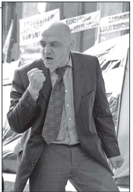
დაუჭერენ თუ არა მხარს თავის თანამარტიელს გაერთიანებული ოპოზიციის წევრები, დღეს გახდება ცნობილი. ბალთურის თქმით, თუკი უმრავლესობა უარს იტყვის გამოძიების დაწყებაზე, ამით მთელი მსოფლიო დაინახავს, რომ ის მართლა გაყალბების გზით არის მოსული ხელისუფლებაში, თუკი მის აღწამობას გაერთიანებული ოპოზიციის წევრებიც არ მოაწერენ ხელს, მაშინ, უხეშად თუ ვიტყვი, ინიციატივა „ჩაფლავდება“.

ამიტომაც სულ არაა გამორიცხული, ისინი პარტიამდებში დეპუტატის ავსუაში ვინილოთ, რადგან აისი შესანიშნავი მხარე უნდა გამოვიყენოთ.