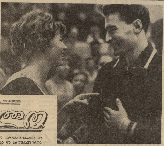
პირადადგენილი პირადადგენილი პირადადგენილი