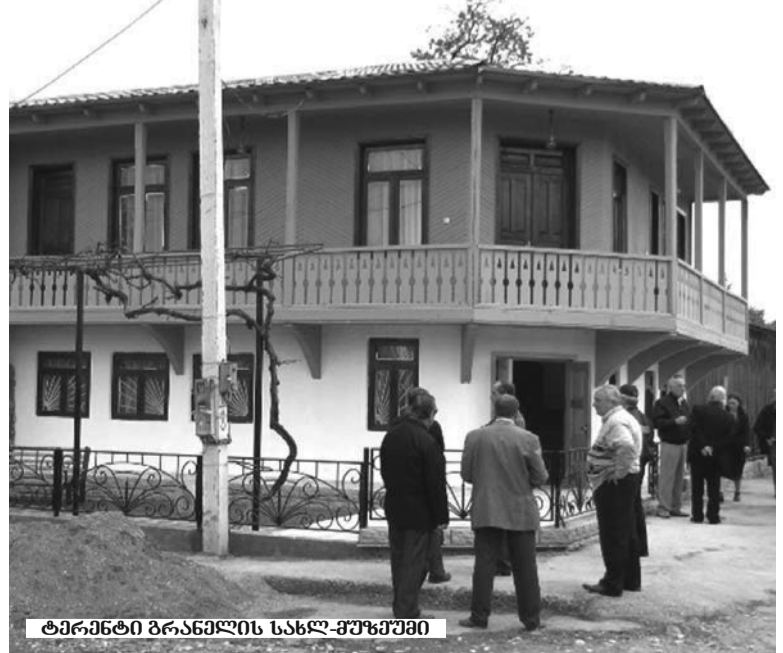
ტარმანტი ბრანდელის სახლ-მუხუშეში

„საერთო გაზეთი“ შეეცდება კვალიფიციური სპეციალისტების მონაწილეობით მომავალშიც გააგრძელოს ამ თემის გარშემო საუბარი.