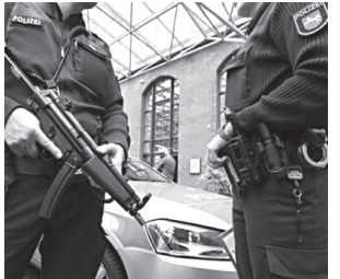
ნა გერმანიის კონტრაბანდის ხელმძღვანელმა.

ეს ჩვენ გვანახებს, ვინაიდან ჩვენ მონაცემთა კარგი ბაზა გავაჩნია, ხდება ევროპულ პარტნიორებთან ინფორმაციის გაცვლა, მაგრამ როდესაც იმ პირების სახელები გვაქვს, ვინც საფრთხეს წარმოადგენს, ჩვენ ვერ ვახერხებთ მათ იდენტიფიცირებას გერმანიაში, – დასძინა გერმანიაში, – დასძინა