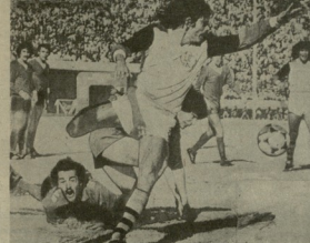
საქართველოს ნაკრები მსოფლიო ჩემპიონატის ფინალურ ეტაპზე მადრიდში მონაწილეობს.

რეალის მრავალხარისხიანი სპორტული კლუბების წარმომადგენლები, რომლებიც მსოფლიო ჩემპიონატის ფინალურ ეტაპზე მადრიდში მონაწილეობდნენ, მადრიდის სასტუმროს მისაღებად, მისი მადრიდის სასტუმროს მისაღებად, მისი მადრიდის სასტუმროს მისაღებად.