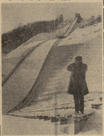
სურათზე: 90-მეტრიანი ტრაპაზოლი.