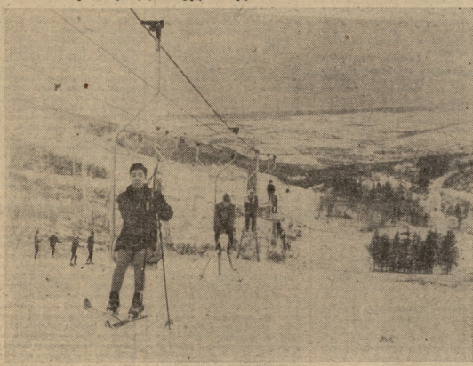
სურათზე: ატიმე ოლიმპიადის.