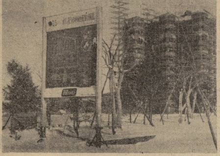
სურათზე: ოლიმპიური სივლის მშენებლობა.