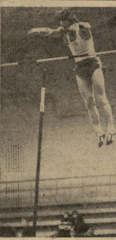
სსრ კავშირის ჩემპიონატის მნიშვნელობის მქონე ადგილობრივი მნიშვნელობის მქონე დამატებითი კონკურსების დასრულების შემდეგ...