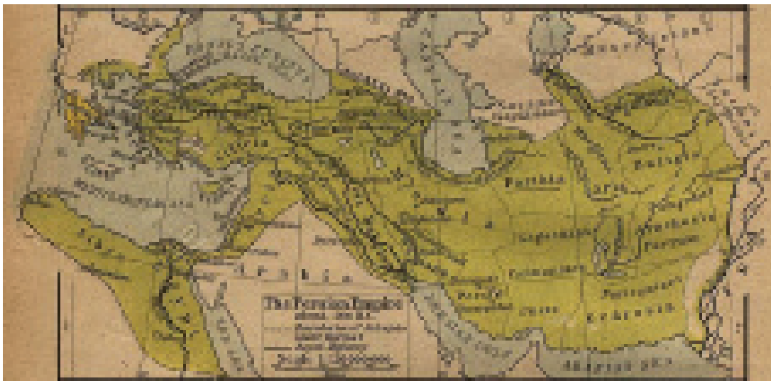
სპარსეთის სამეფო 506. ძვ. წ. აღ.-ით