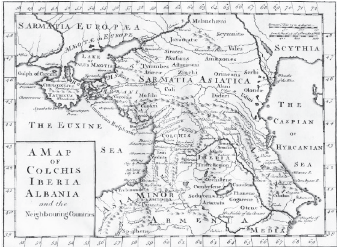
უძველესი სავაჭრო საერთაშორისო გზა