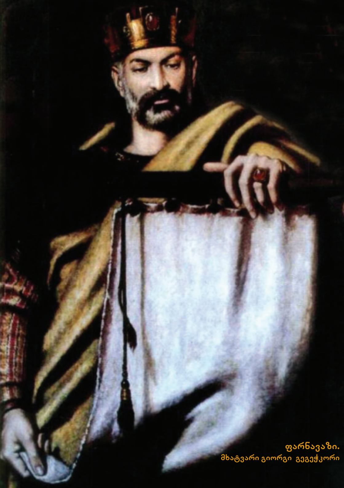
ფარნავაზი. მხატვარი გიორგი გეგუჭკორი