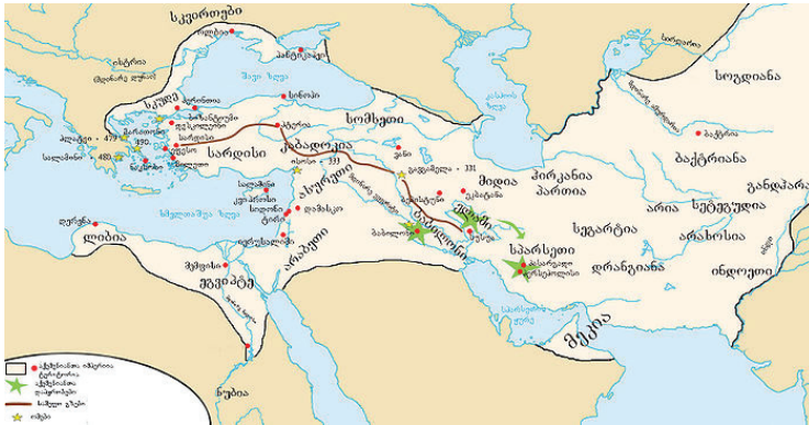
ალექსანდრე მაკედონელის ბრძოლები დარიოსის წინააღმდეგ