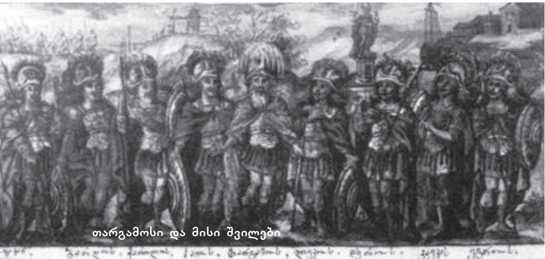
თარგამოსი და მისი შვილები

იაფეტის მემკვიდრეობითი შტოს შთამომავალი იყო თარგამოსი, რომელსაც რვა შვილი ჰყავდა: ჰაოსი, ქართლოსი, ბარდოსი, მოვაკანოსი, ლეკოსი, ჰეროსი,