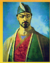
საბავშვო ვეფხისტყაოსანი სურათები და ტერმინოლოგია