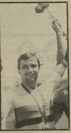
სტალინი... (ბ-2 აპ)