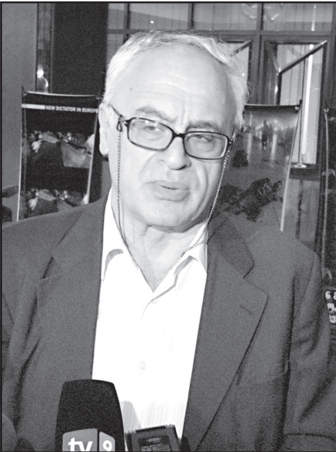
სახელმწიფო უსაფრთხოების სამსახურის უფროსი

– რთულად სათქმელია, რადგან მელიამ ეს არჩევნები ერთხელ უკვე წააგო. ტექნოლოგიის ლოგიკით, ნაციონალურ მოძრაობას ახალი კანდიდატის მოძიება მოუწევს.