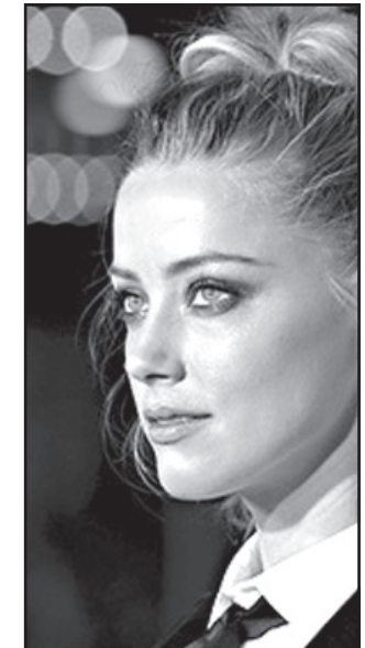
მოამზადა კახა ხატიაშვილმა

ბიზნესმენი ილონ მასკი დამფუძნებელია კომპანიის, რომელიც უშვებს რაკეტებსა და კოსმოსურ ხომალდებს და ასევე ტესლა მობილური (ელექტრომობილების მწარმოებელი კომპანია). ის ასევე სხვადასხვა კომპანიების თანამშრომელი და პროექტების ინიციატორია. მისი ქონება 10,6 მილიარდ დოლარადაა შეფასებული.