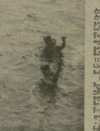
არაა რუსეთის ეფემერი, ეფემერი