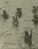
ქართველი ფალსიდი (155,03 წელი)