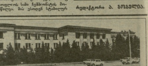
ԵՐԵՎԱՆԻՔԻ ՄԱՐԾԱԿԱՆ ԳՅՈՒՑ... Գրական գործողությունները կատարվում են ընդհատաբար...