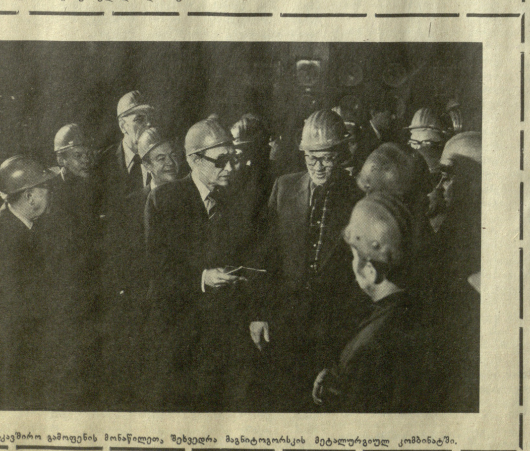
საკეპროსი გამოყვანის მონაწილეა შეხვედრა მანტიკოვსკის მეტალურგიული კომბინატში.