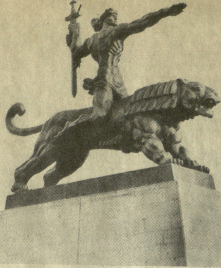
ალეკსანდრე ნევესკი. გამარჯვების მონუმენტი გორში „ბორცხის ხეობა“.