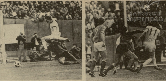
სპორტის მოყვარულნი... სპორტის მოყვარულნი...