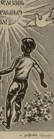
ა. ვიქსიღის პორტრეტი