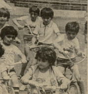
ა. ბავთღი ბ. ბავთღი გ. ბავთღი

ბავთღი ბავთღი ბავთღი ბავთღი ბავთღი ბავთღი ბავთღი ბავთღი