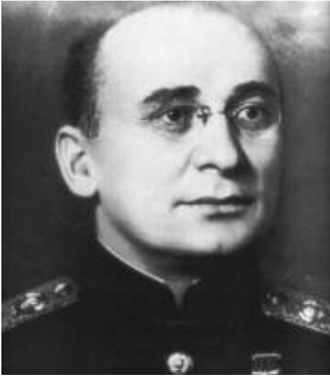
(გაგრძელება წინა ნომრიდან)

1938 წლის ივლისში ორლოვმა მიიღო ანტევერპენში გამგზავრების ბრძანება, რათა შეხვედროდა წარმომადგენლებს.